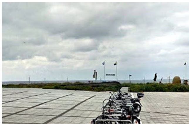
1. Wedrou : Zandvoort - Estuarium