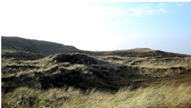
5. Marrarmanis Litus : Camperduin - Marine aan de kust