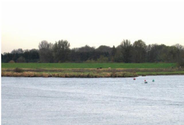
4. Insula Flevo : Kampereiland – Romeins kamp in Kampen