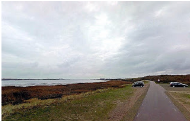
7. Tecelia : Texel - Naval Nautisch kamp in Mokweg