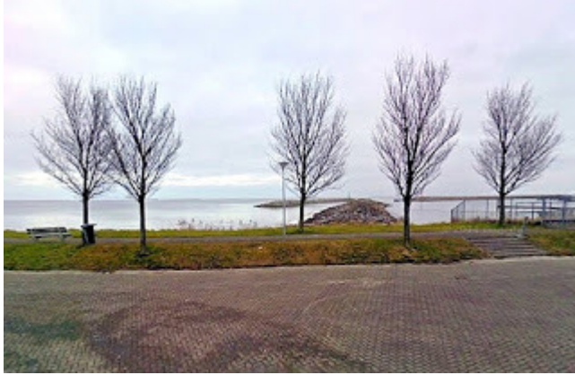
6. Mediolanum : Ingelopen-Kreupel wagenpad-Hindelopen. Een dijk, weg en brug van Medemblik naar Stavoren in het Flevomeer