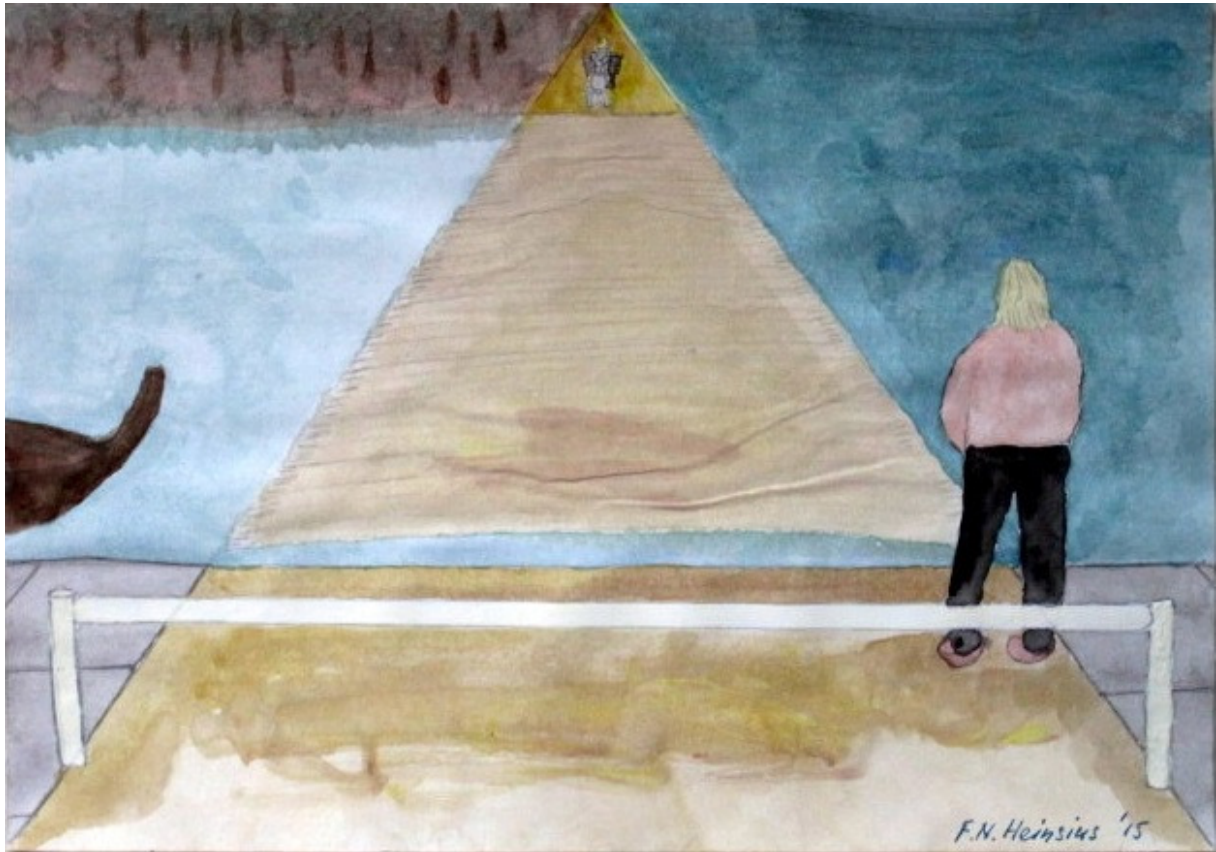
De brug te Stavoren met tol in de oudheid