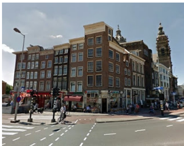
2. Ascalingion : Kamperhoofd en Kamperbrug - Romeins kamp in Amsterdam genaamd Nabalia op het snijpunt van de rivieren Waal (Oude Waal) en Amstel (Ascal, Angstel, Amstel)