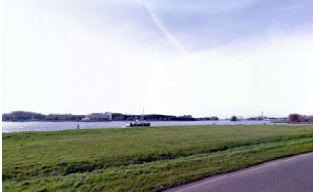
3. Navalia : Velsen - Naval Nautisch kamp in Velsen Site 1